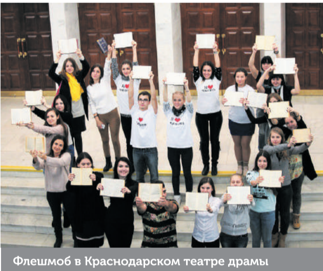
Флешмоб в Краснодарском театре драмы

тет непрерывного и дополнительного образования для подготовки к ЕГЭ по истории. На протяжении девяти месяцев я регулярно приезжала на лекции и в результате успешно сдала ЕГЭ по истории на 100