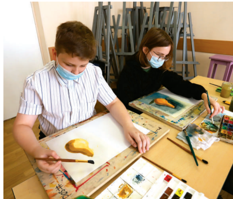
Ученики пятого класса