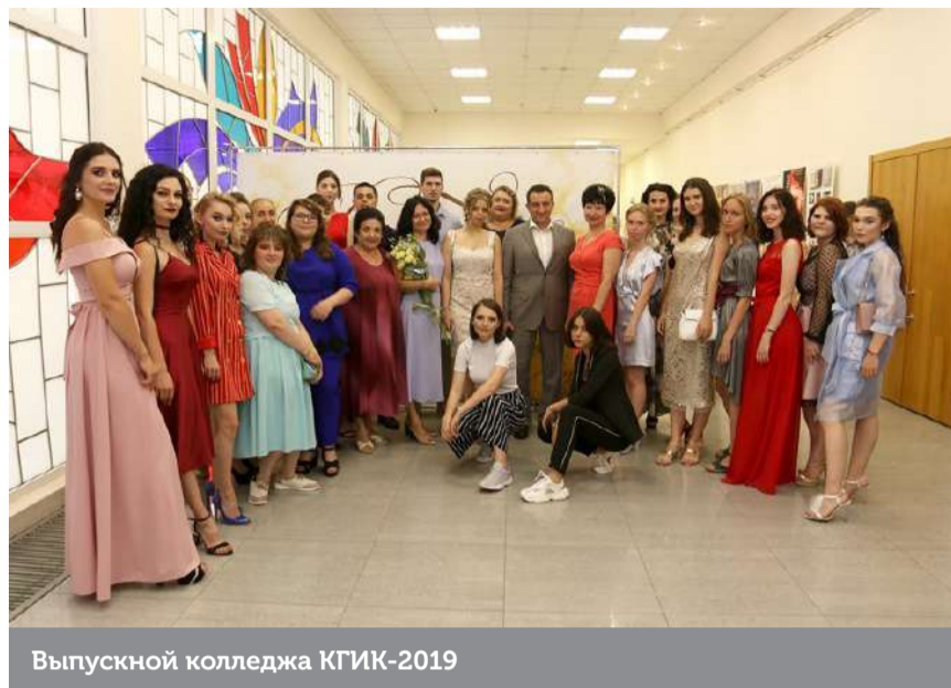
Выпускной колледжа КГИК-2019