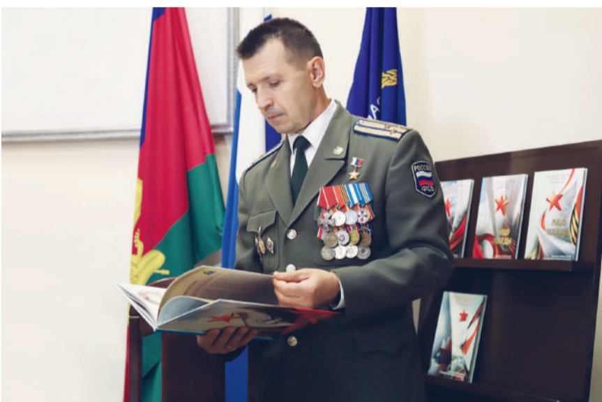
Герой Российской Федерации Евгений Шендрик