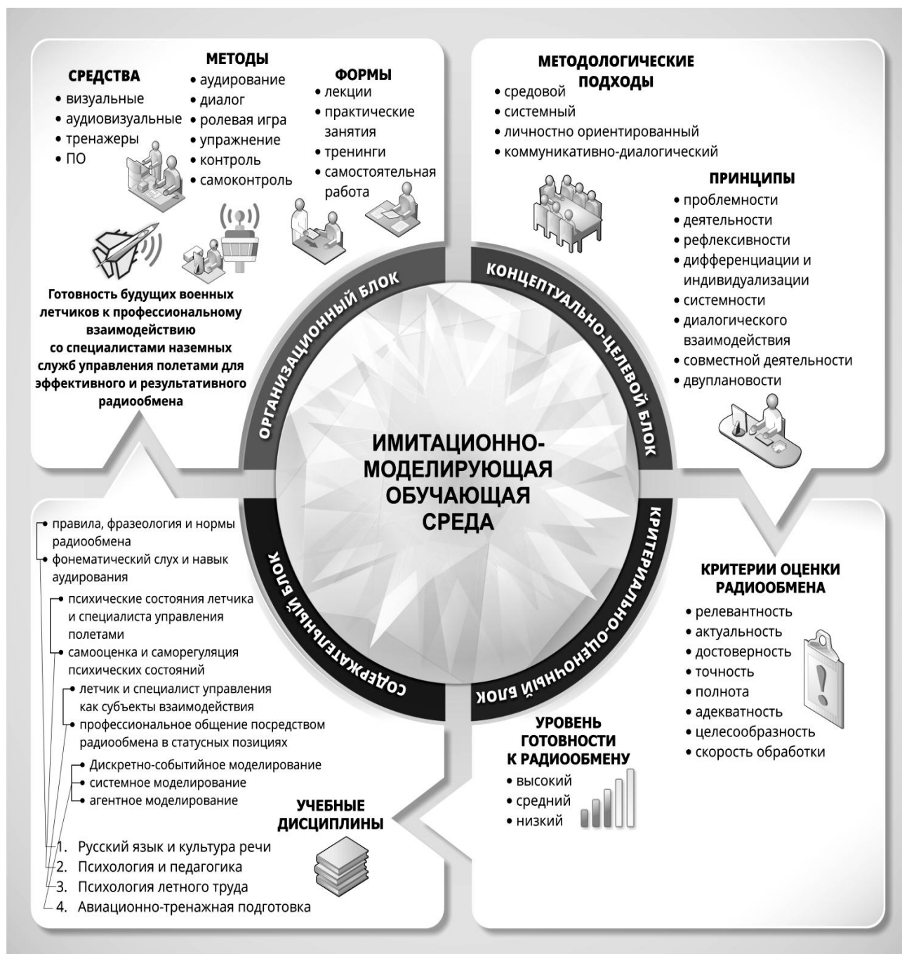
Рисунок 1 – Модель имитационно-моделирующей обучающей среды подготовки будущих военных летчиков к профессиональному взаимодействию со специалистами наземных служб управления полетами

радиообмена в режимах «реальное время», «замедленное время», «реверс времени» и «стоп-время», а также возможности для внесения неожиданных для участников радиообмена изменений в профиль «полета», полетные задания, режимы работы двигательной установки и оборудования, метеоусловия, ситуацию на аэродроме и т. п.