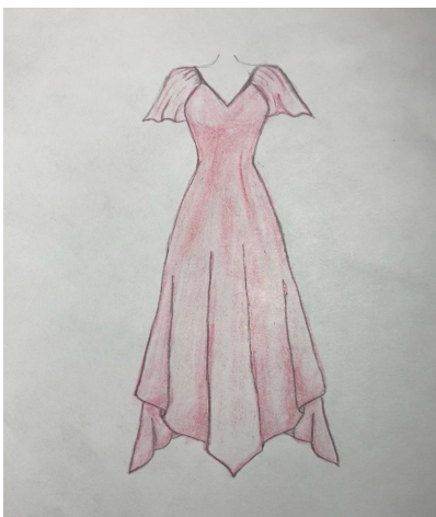
Рис. 1 Костюм главной героини

Допускается нумеровать иллюстрации в пределах раздела. В этом случае номер иллюстрации состоит из номера раздела и порядкового номера иллюстрации, разделенных точкой.