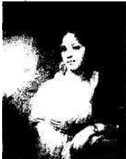
«Портрет М.И. Лопухиной» кисти Боровиковского.